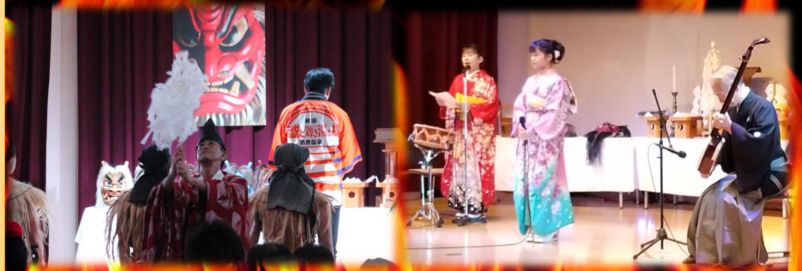
「イメージ: なまはげ入魂儀式&三味線・秋田民謡」